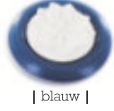
| blauw |