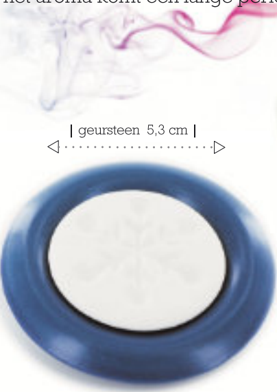
| geursteen 5,3 cm |