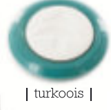
| turkoois |

100% natuurlijke geurcomposities van Biobox.