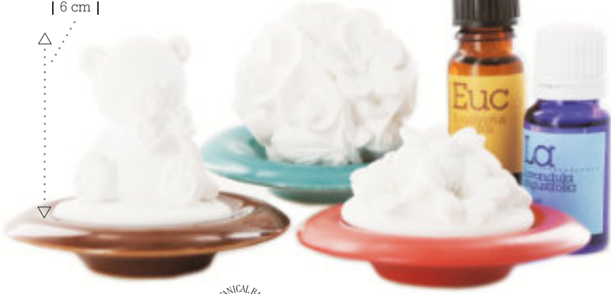
| jasmijn |