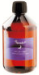
| terra |