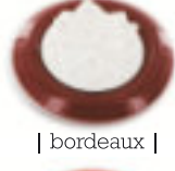
| bordeaux |