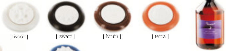
| ivoor |