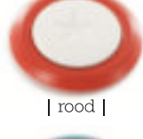
| rood |